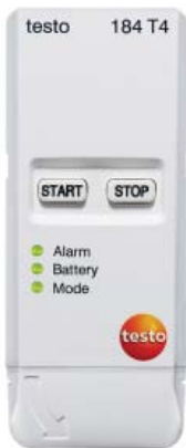
testo 184 T4