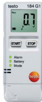
testo 184 G1